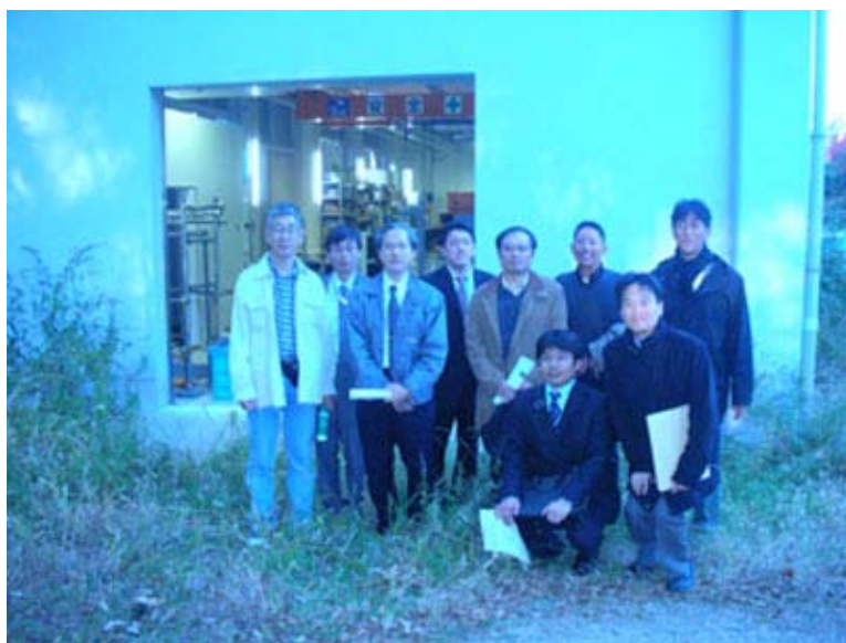
研究室めぐり参加者の皆様