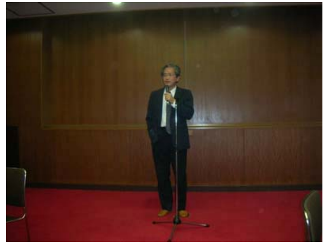
藤田教授あいさつ