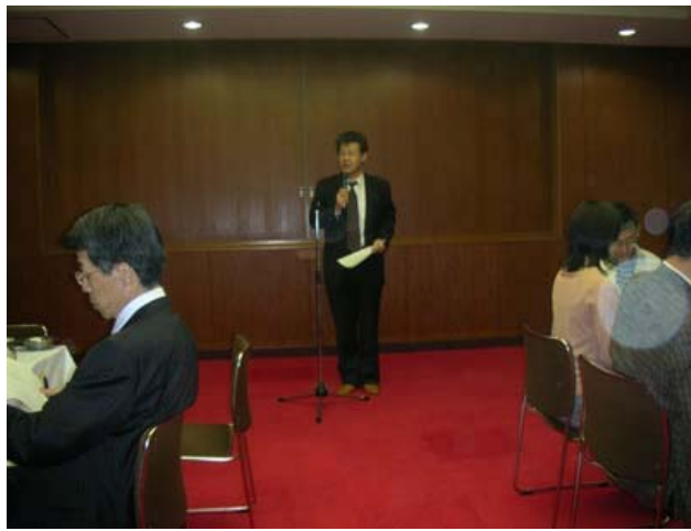
道奥教授あいさつ