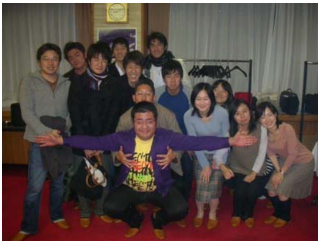
今年も多くの学生に出席いただきました