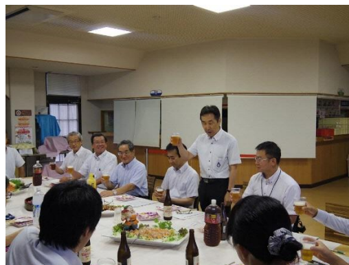
写真 2：意見交換会の様子