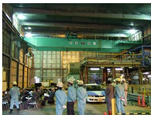
■ 施工基地となる防音建屋