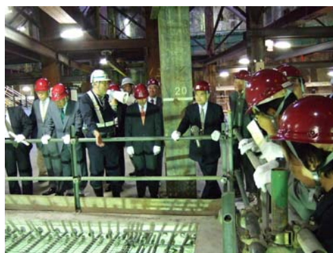
■ 高速道路函体上での工事説明