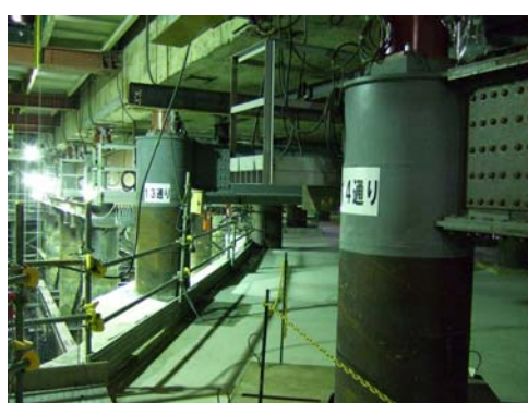
■ 地下鉄函体を支える仮受杭