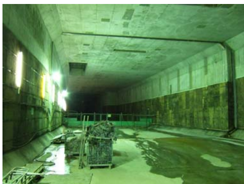
■ 完成した高速道路の函体