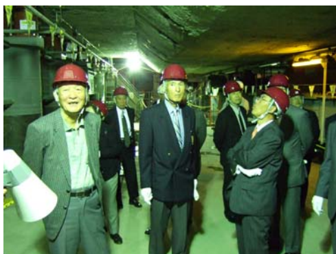
■ 写真の上部が地下鉄函体