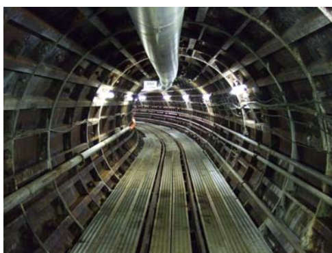
■ 1次覆工が完了した大容量送水管