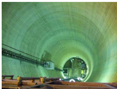
■ 立抗 (φ 10.5m、H 約 60m)