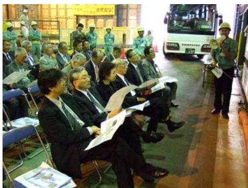
■ 神戸市水道局からの概要説明