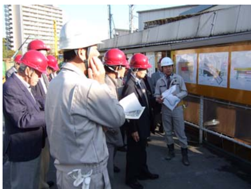
■ 阪神高速道路㈱からの概要説明