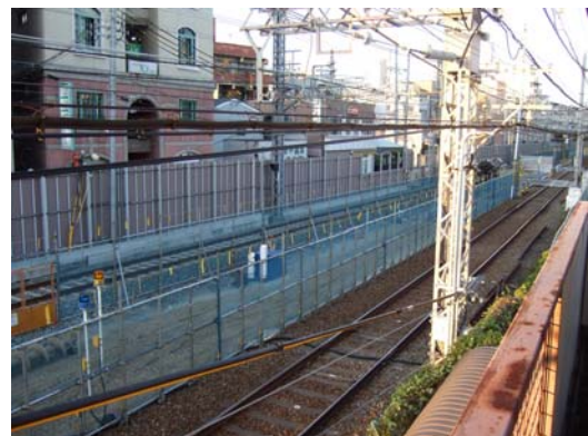
■ 現在の工事状況(仮線路の整備)