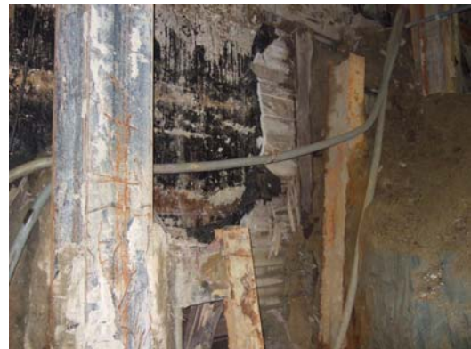
■ 昭和8年当時の土留、防水工