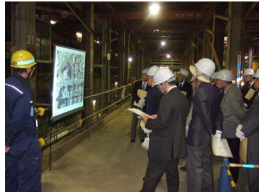
■ 阪神電鉄躯体上での工事説明