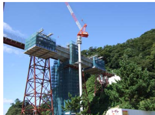
■ デイライト工法による施工状況