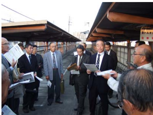
■ 神戸市都市計画総局からの説明