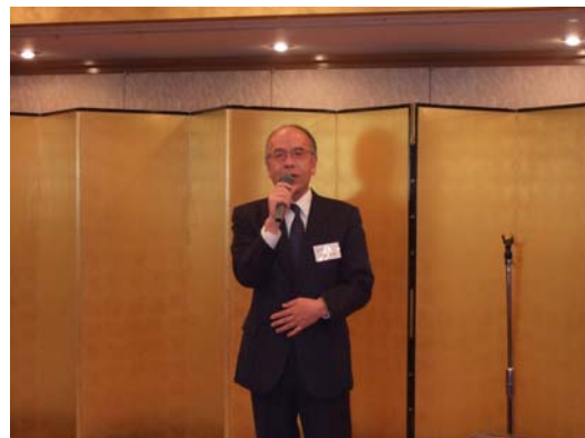
■ 河南嘉彦氏 中締め