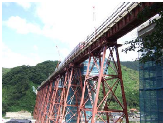
■ 余部橋梁と架替工事の全景