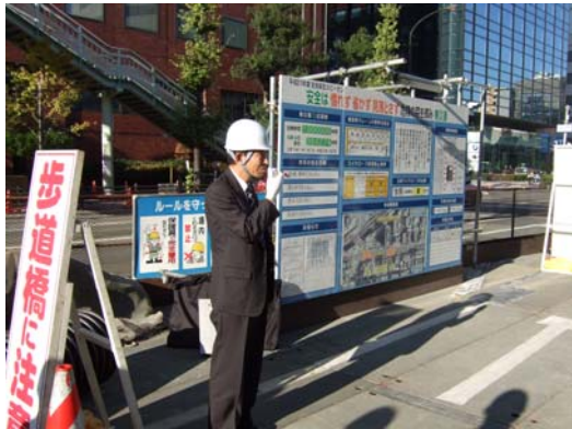
■ 神戸市都市計画総局からの説明