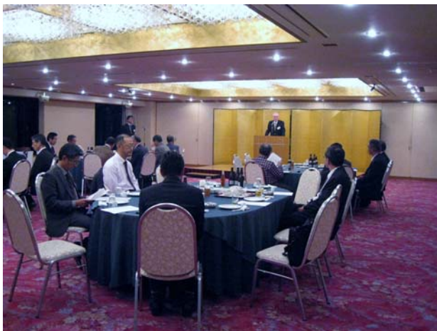
本下代表世話人の挨拶