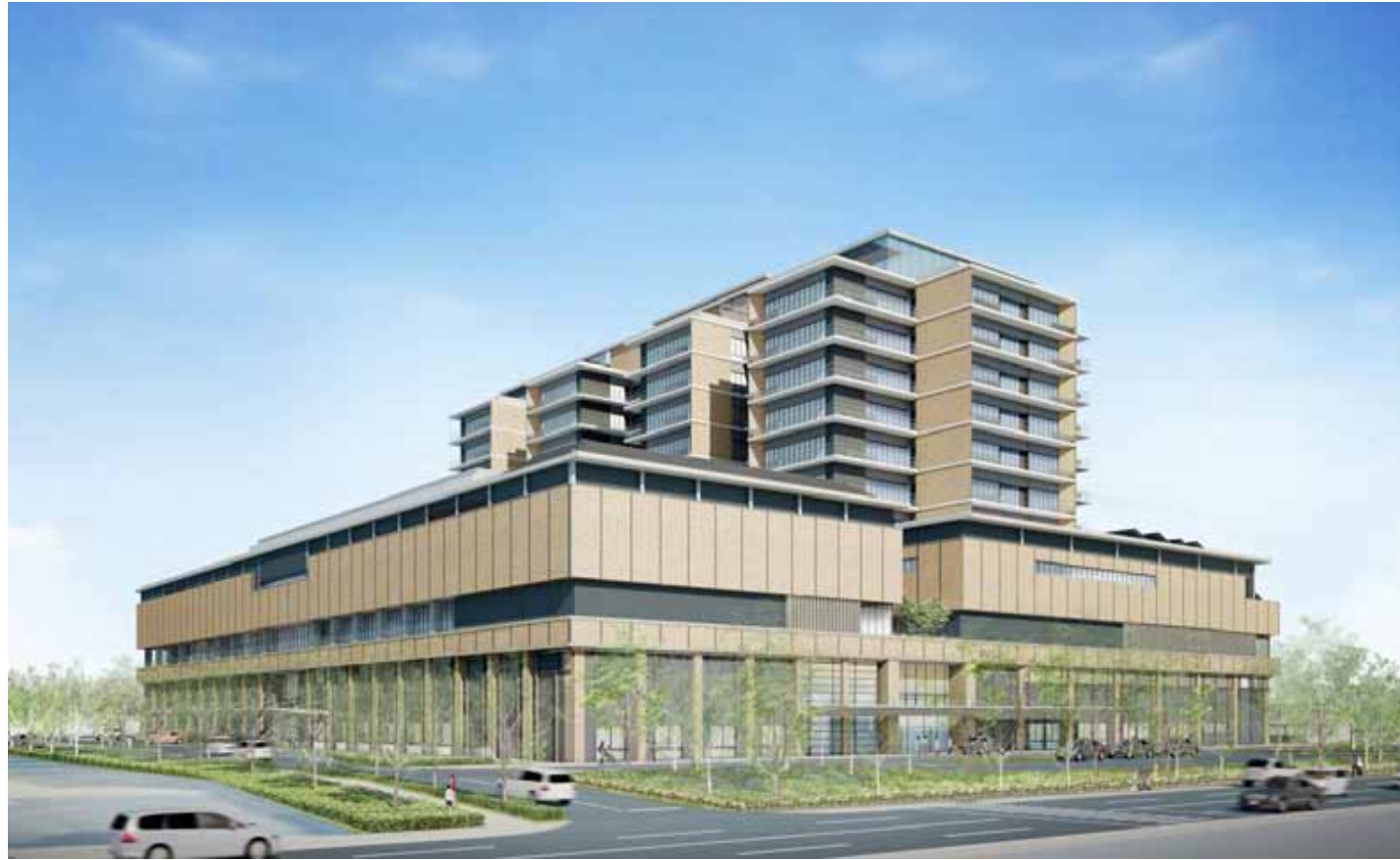
外観パース(県道側より)