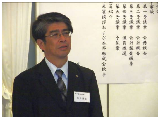
■長谷 東京支部長 挨拶