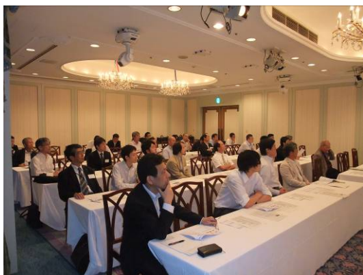
■講演会聴講の様様