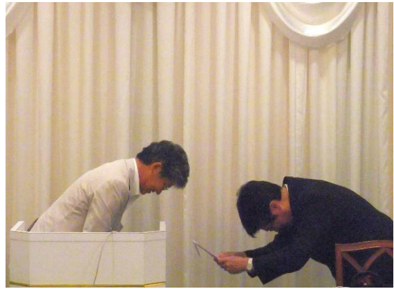
■本部助成金目録授与